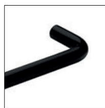
Matte black Negro mate