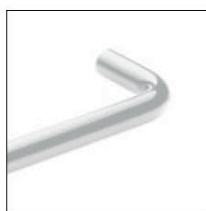
Glossy white Blanco brillo